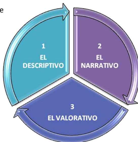
NIVELES DE REFLEXIÓN

Por otro lado, se concuerda con las sugerencias de Ricoeur (2002) en torno al cuidado de los niveles de reflexividad. Los niveles de la reflexión deben seguir ciertas etapas: el descriptivo, el narrativo y el valorativo. En la fase descriptiva se examina cada una de las acciones en las que está implicado, en la fase narrativa se toma conciencia de la unidad o totalidad de la práctica y en la fase valorativa se juzga si las acciones cumplen determinadas reglas de la profesión.